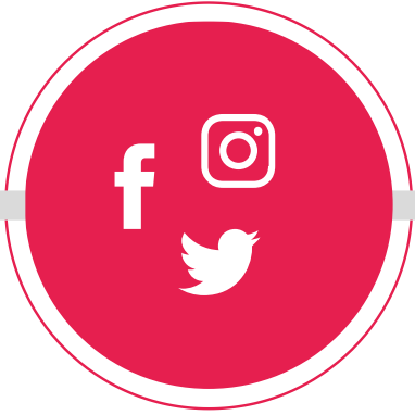
İNTERNET VE SOSYAL MEDYA