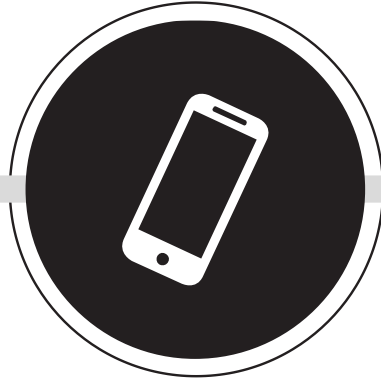
TELEFON VE TABLET