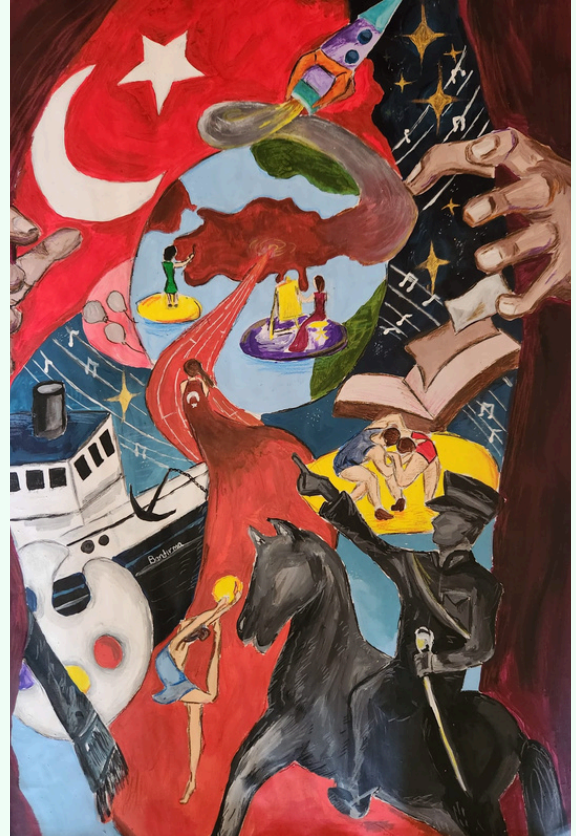
Emine KALAY 12/D