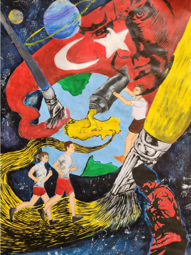
Kürşat KARAGÖZOĞLU 11/B